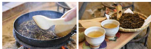
手作業で焙煎中のほうじ茶。香ばしい香りが広がります。(左下)