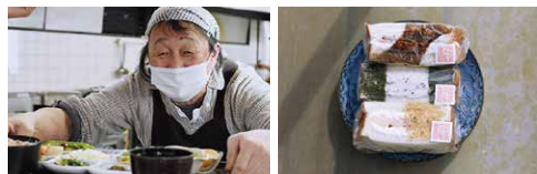
フレンチシェフが作るお酒落で美味しいサンドイッチ。(右下)