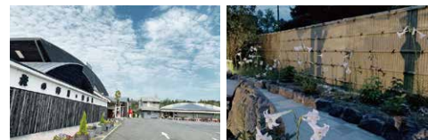
源泉風呂(かけ流し)やサウナもあります。(左下)