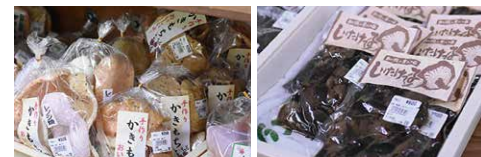
実は特産品である原木椎茸の佃煮。(右下)